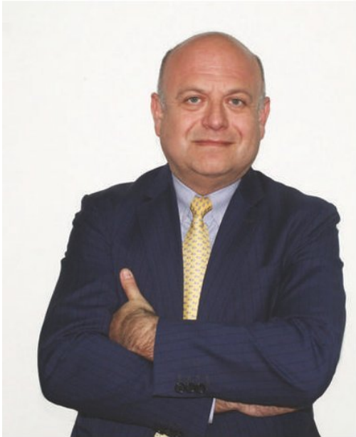
Por José Lagos , Docente UEjecutivos, Facultad de Economía y Negocios de la Universidad de Chile.

La publicación de la nómina de Operadores de Importancia Vital redefine el alcance de la ciberseguridad en Chile, trasladándola desde el ámbito técnico hacia la estrategia, la gobernanza y la responsabilidad de directorios y autoridades, en un escenario donde la continuidad digital ya es un asunto de interés público.